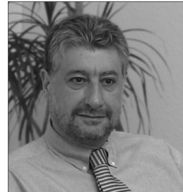
José María Fidalgo